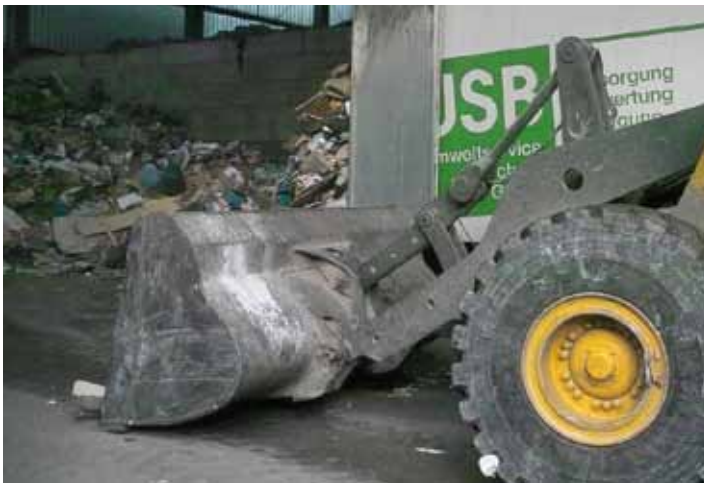
Zuerst wird grob vorsortiert. Natürlich mit schwerem Gerät.

In manchen Fällen, dann wenn wieder einmal die Müllfledderer ganze Arbeit geleistet haben, müssen sogar noch die Kehrmaschinen