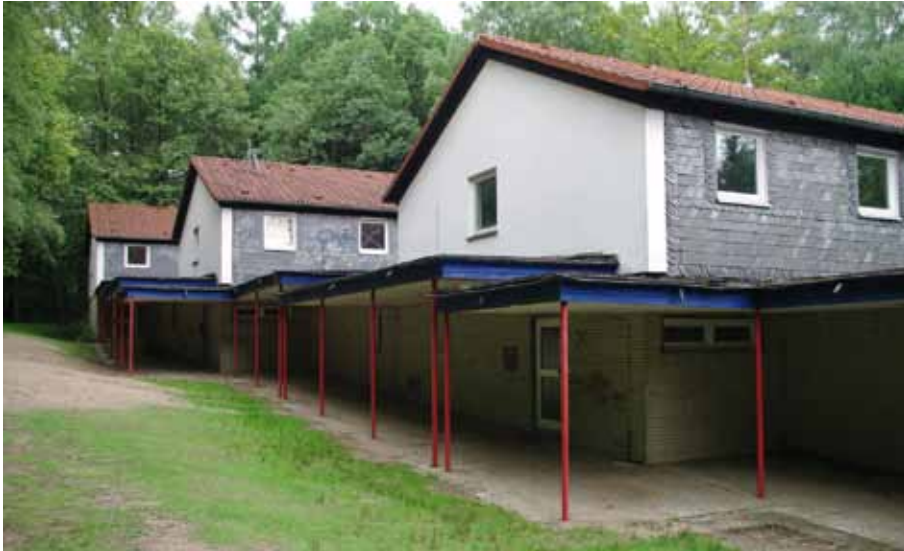
Hier soll das ökumenische Kinderhospiz entstehen - das ehemalige Gelände des Kinderheims an der Kaisereiche.

Kinderhospiz in Wuppertal – Baubeginn in 2012 geplant