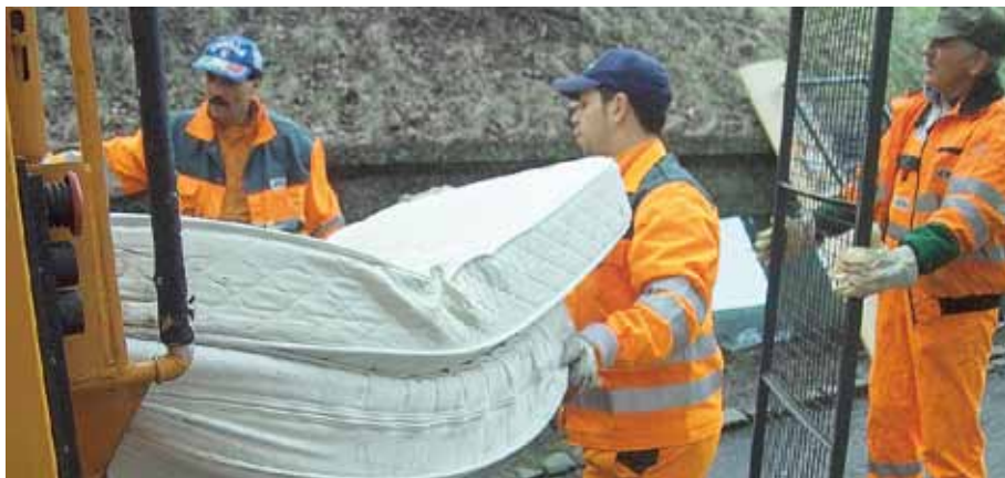
Früh am Morgen in Wuppertal. Die AWG braucht starke Männer für einen echten Knochenjob.