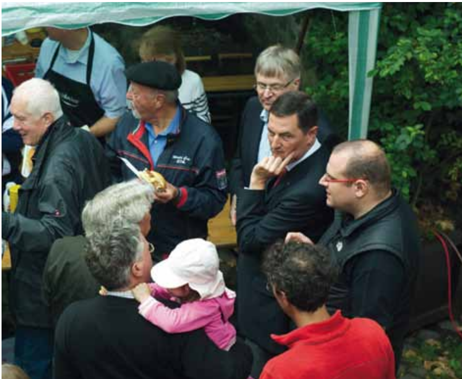
Die verbliebenen Gäste des Sommerfestes diskutieren mit Oberbürgermeister Peter Jung – auch hier ist die gute Stimmung dahin, man steht sich gleichwohl offen gegenüber.